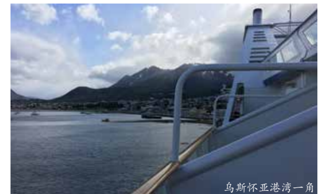
乌斯怀亚港湾一角

不知道我们中国人为什么将海南三亚称为“天涯海角”，乌斯怀亚才应该真正被称为“天涯海角”，这也许就是世界观的差别。正因为连阿根廷人都觉得遥远，所以乌斯怀亚所在的“火地岛”100年前就是阿根廷流放犯人的地方，至今还完整地保留着关押犯人的监狱、运送犯人去劳动的窄轨火