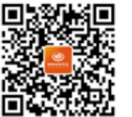
扫一扫输入“北极”获取更多